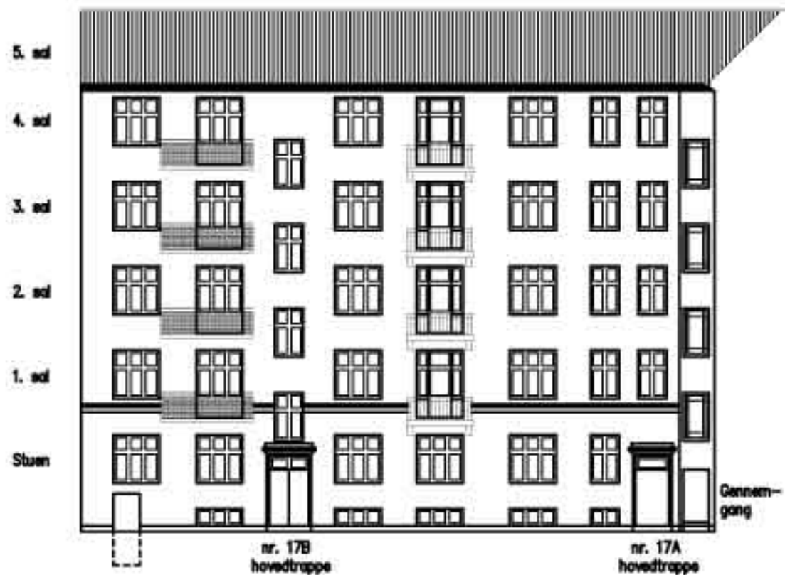
Facadeudsnit, princip ca. 1:200